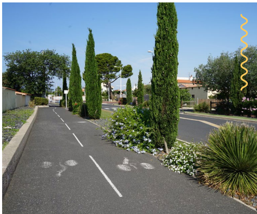
Commune du Soler (Pyrénées-Orientales)