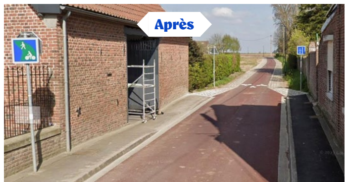
Aménagement cyclable à Sainghin-en-Weppes (Nord - 59)