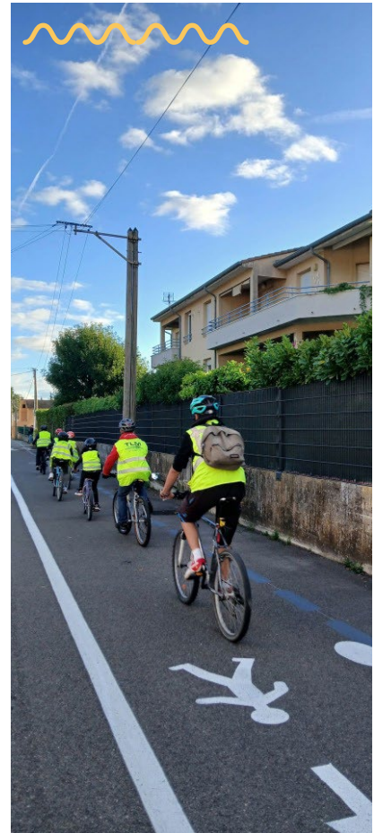
Le Teil (Ardèche - 07)

C'est un sujet concret, partagé, non partisan, qui parle du quotidien. À travers les 334 000 réponses collectées via le Baromètre vélo 2025, les citoyen-nes ont déjà exprimé leurs besoins. À l'approche des Municipales, les communes ont maintenant l'opportunité de transformer cette parole citoyenne en action publique visible, au service d'une mobilité plus juste et plus libre.