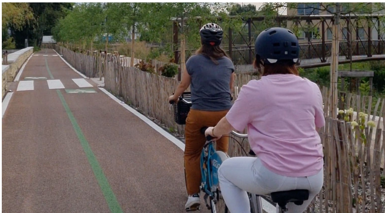
Aménagement cyclable à Bourg-en-Bresse (Ain - 01)

Jean-François Debat, maire de Bourg-en-Bresse